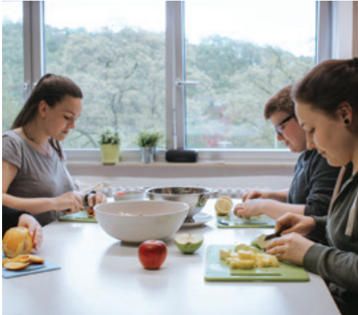
Zubereitung von Obstsalat für einen gemütlichen Fernsehabend // gemeinsamer Sport im Grünen // Experimentieren in der Chemie-AG