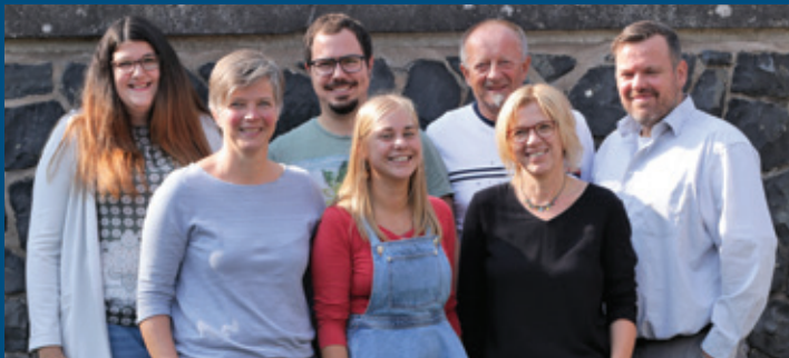
Das Team der Erzieherinnen und Erzieher